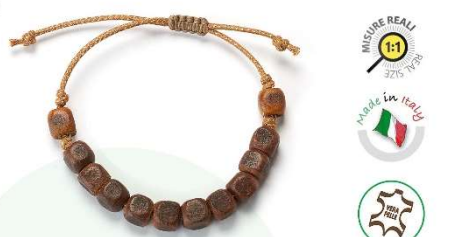
RES 050-C.CU mm. 8x8