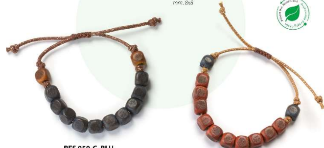
RES 050-C.BLU mm. 8x8