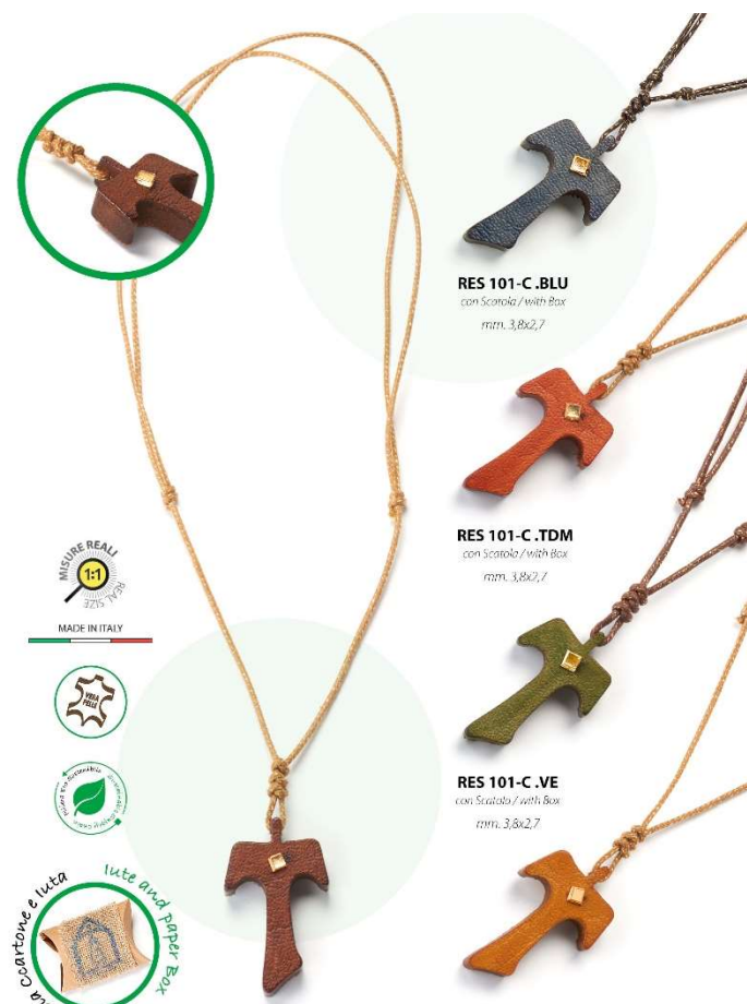
RES 101-C.BLU con Scatola / with Box mm. 3,8x2,7