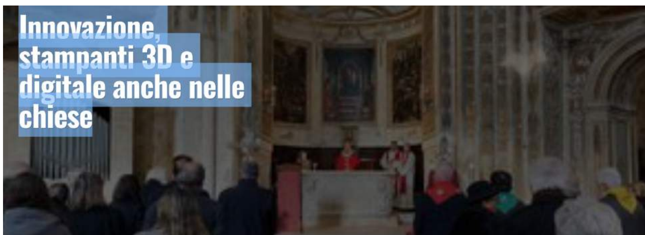
A "Devotio 2024" approdano i visori immersivi e i sistemi di automazione