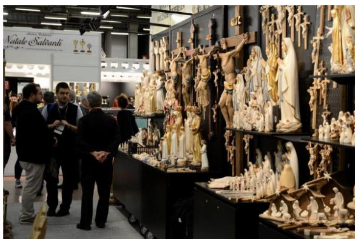
Rosari e statuine, è boom prodotti made in Italy

Grande successo nel mondo per l'Italian style nel settore dei prodotti religiosi. La produzione italiana è apprezzata soprattutto per l'oggettistica devozionale (come i rosari, le medagliette e le statuine), nei paramenti per la liturgia e anche negli arredi sacri, calici, ostensori e altri oggetti per il culto. Grandi acquirenti in Europa si confermano le zone che ospitano i principali santuari, da Lourdes a Fatima, fino a Medjugorje, mentre si registra negli ultimi anni una notevole crescita dei Paesi asiatici, con in testa Corea, Giappone, Filippine e anche Cina. Non meno attivi il Nord e il Sud America e pure il grande continente africano, grazie soprattutto alla presenza delle comunità religiose missionarie.