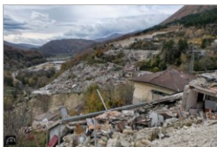
Quel che resta di Pescara del Tronto