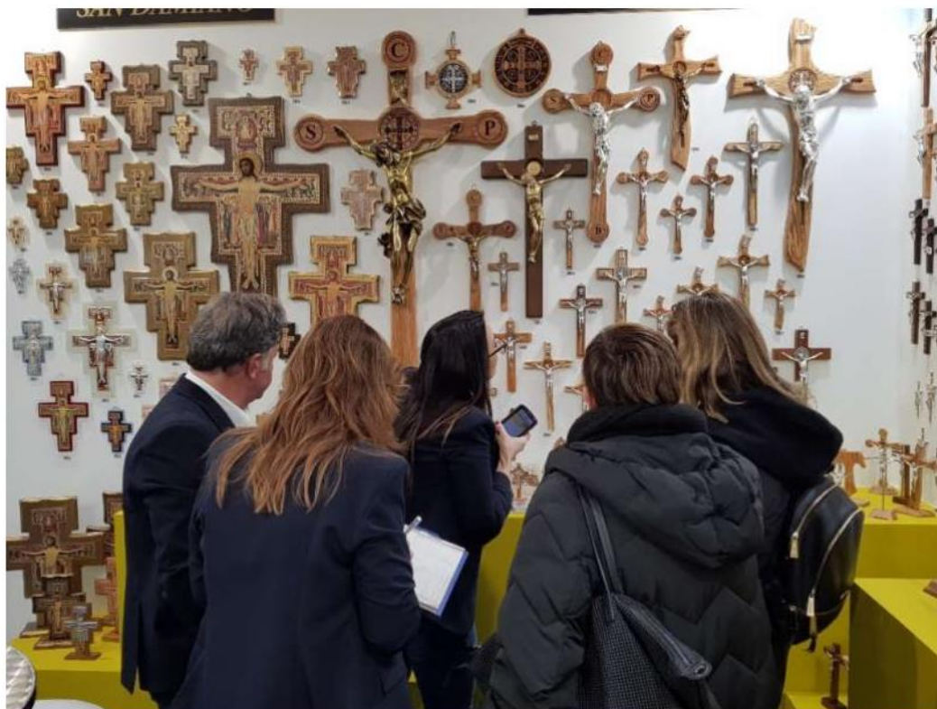
Articoli religiosi

Cresce nel mondo il mercato degli articoli religiosi prodotti in Italia