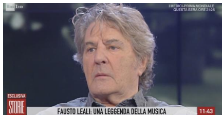
Storie Italiane, Fausto Leali e la rivelazione-choc su Anna Oxa: "Non dipende da me, eppure..."