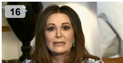
Daniela Santanchè contro Renzi a Omnibus: "Nessuna crisi di governo, si è venduto l'anima per la poltrona"

scena altamente poetica. Evocando antiche rappresentazioni di sapore paleocristiano, senza nascondere alcune suggestioni orientali, la sua attenzione si è concentrata sulle piaghe di Cristo, da cui esce sangue abbondante sotto forma di piccolissimi semi, di cui si nutrono alcuni piccoli uccelli in volo: il sangue di Cristo si fa così seme di vita per i fedeli.